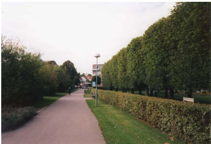
Grönstråk i Gunillaparken.

begrepp för benämning av närkreation. Den andra typen av grönområden är stadsparkerna som också kan inkludera kyrkogårdar. Dessa är viktiga gröna mellanrum i den täta bebyggelsen. En tredje typ är grönstråken där det gröna ofta består av trädrader invid en bilgata eller gång- och cykelväg.