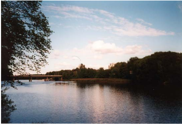
Skymning över Nissan. Bakom träden sticker Gamle Tulls bostadsområde fram.