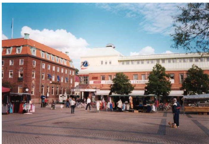
Kommers på Stortorget.

Tillverkningsindustrin är mångsidig och har en stark ställning med många utvecklingsbara företag. Genom medvetna satsningar på utveckling introduceras många produkter med stora framgångar på den internationella marknaden.