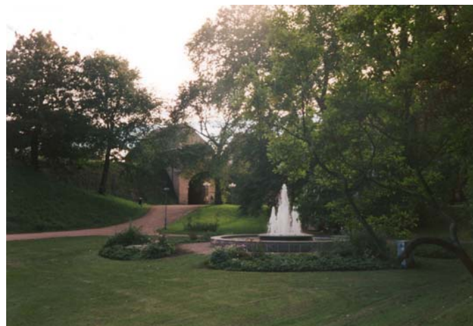
Norre Katts Park. Porten in till affärerna på Storgatan skymtas i bakgrunden.

Halmstads grönstruktur är viktigt att belysa inte bara för att det under senare år ställts större krav på detta i ett vidare perspektiv utan också för att stadens gröna ytor spelar en stor roll för människors hälsa och trivsel. Stadsnära grönområden och stadsparker ökar Halmstads attraktivitet och kan bidra till ökad inflyttning av boende och företag. I Halmstads översiktsplan och i "Handlingsprogrammet för ekokommunen Halmstad" görs fylliga beskrivningar av grönstrukturen.