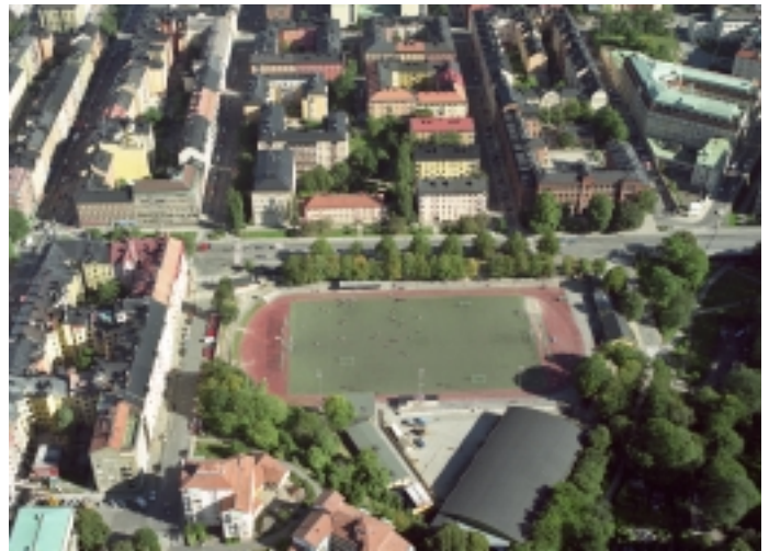
Bild 13 Zinkensdamms idrottsplats