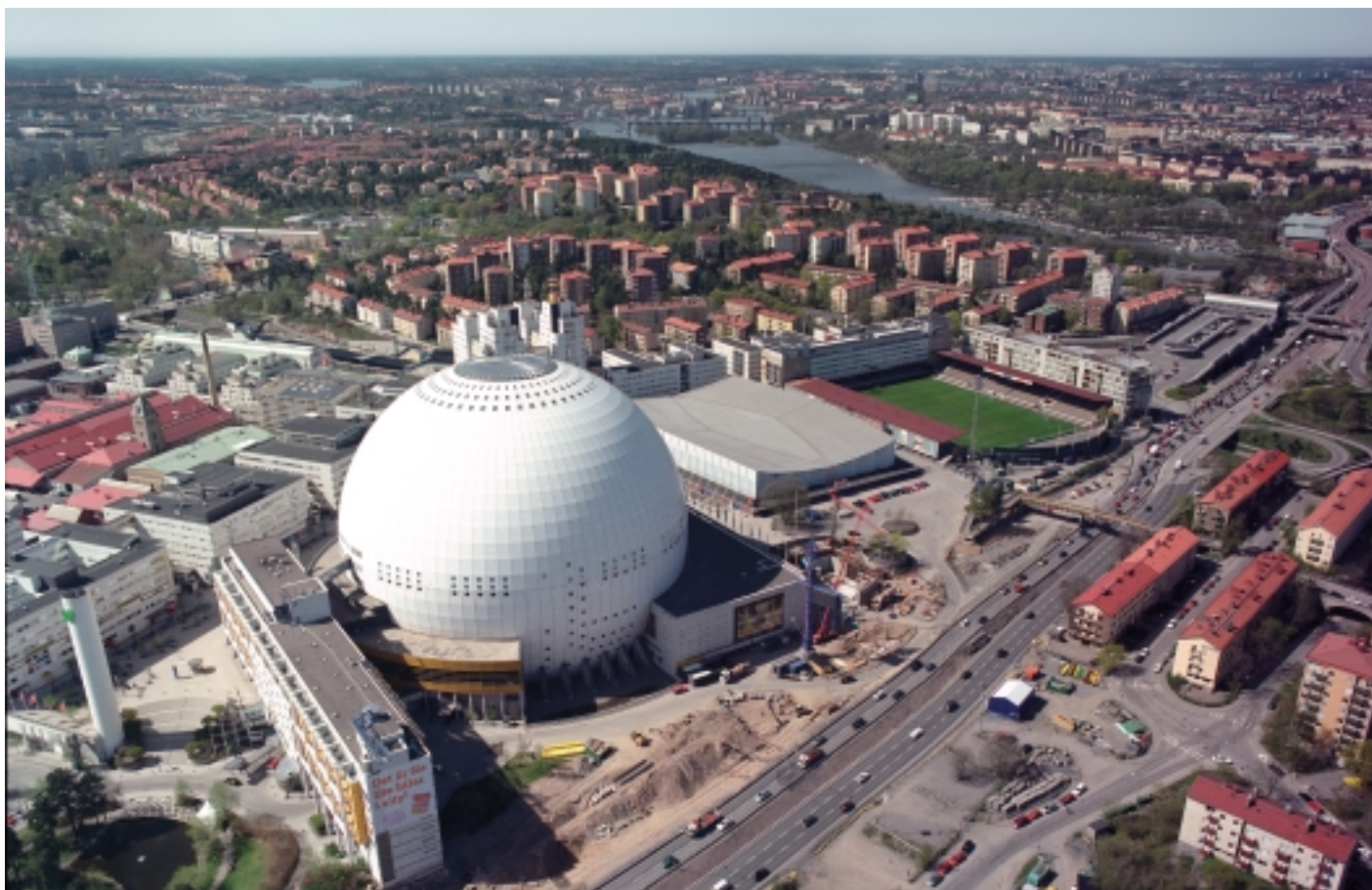
Bild 10 Globen