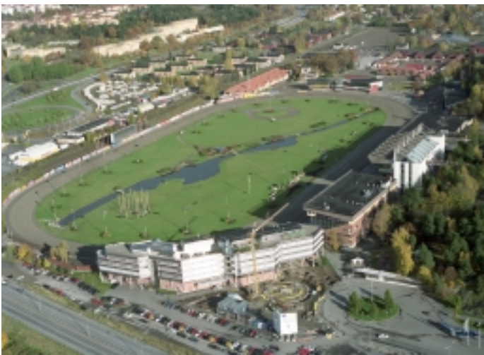
Bild 12 Solvalla travbana

En något underskattad negativ effekt av stora arenor är den rädsla och oro många människor känner inför att något skall inträffa. När ett stort evenemang nalkas är det vanligt att de närboende känner oro inför evenemanget då de vet att de kommer ha bilar parkerade framför sina hus, massor av människor som kommer att dra fram genom bostadsområdet med allt som det innebär, oro för att ljudnivån kommer att vara så hög att det blir svårt att sova m.m. En annan sida av detta fenomen är den rädsla en åskådare på det aktuella evenemanget kan känna inför att kanske hamna mitt i ett slagsmål eller ett upplopp.