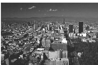
Mexico City tillhör mångmiljonersstäderna.

Resultatet av konferensen 1996, om boende- och bebyggelsefrågor, var de två dokumenten Istanbuldeklarationen och Habitat Agenda. Habitat Agendan innehåller principer, åtagande och en global plan för agerande för medlemsländerna fram till år 2020. ( Nyström, 1997, s. 5 )