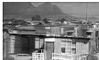
Kakstäderna växer fram i städernas utkanter.

I samband med konferensen bildades en speciell kommission för boendefrågor. Den verkar internationellt för bättre boendeförhållanden i världen. Antingen direkt genom projekt eller indirekt genom att påverka beslutsfattare i regeringar. Under 2001 hölls ett uppföljningsmöte