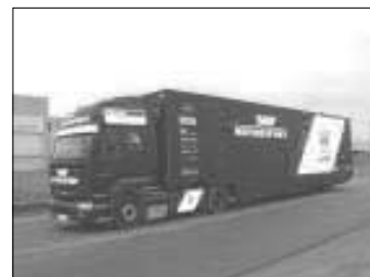
En stor andel av varor och produkter transporteras med lastbil.