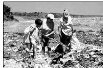
Familj letar efter mat på en soptipp.

Den grundläggande lösningen ligger i att förändra män-