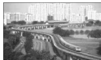
Trafiklederna försörjer städerna med trafik.