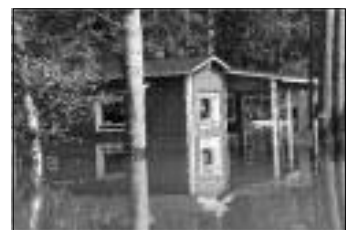
Klimatförändringar kan vara orsaken till översvämningar.