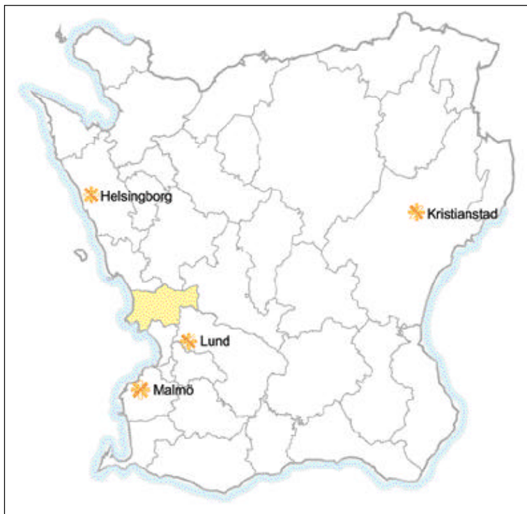
Kävlinge kommun i Skåne.

Planering är ett sätt att förbereda sig för framtiden. Det kan vara fråga om att idag vidta åtgärder för att uppnå en eftersträvd framtid eller att förhindra en oönskad utveckling. Dilemmat är att vi saknar kunskap om framtiden.