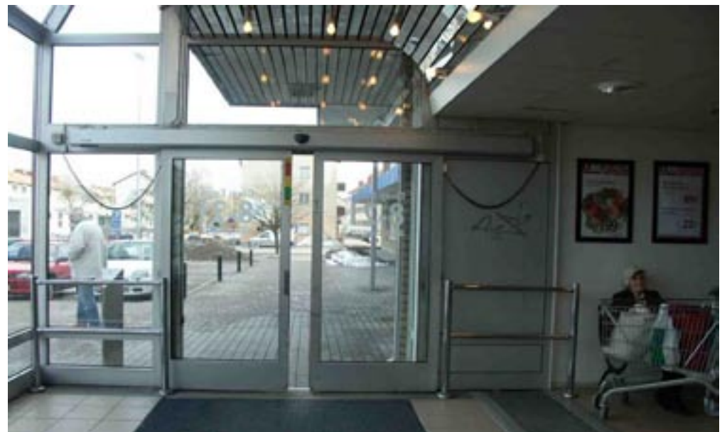
Bild 11. Man är inne i entrén och kan nu se den nästkommande vyn på andra sidan av entrén.