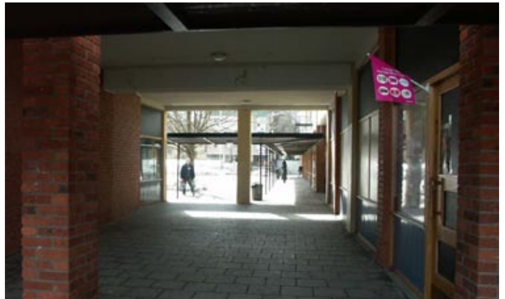
Bild 2. När man går in i hålet vänjer sig ögonen vid den lägre ljusstyrkan och torget utanför ses mest bara som ljus.