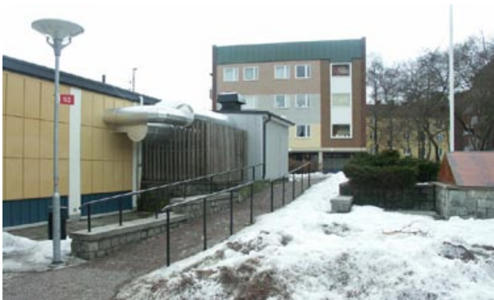
Bild 12. Höjdskillnaden gör att det som kommer i den nästkommande vyn inte direkt ses.