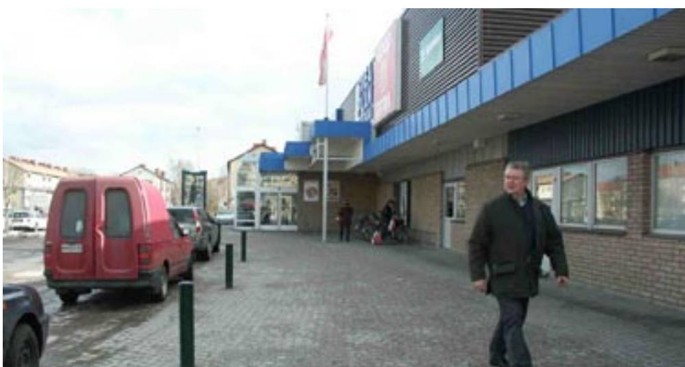
Bild 7-10. På ena sidan av platsen. När man korsat vägen och går in på platsen blir allting fram till entrén här och fortsättningen inuti och på andra sidan är okänd. Eftersom platsen är så smal kan man inte välja om man ska gå mitt på eller i kanten av, det känns som om det är samma sak.

Bild 1-6. (Till vänster) Vid sidan av. Gående på gång- och cykelvägen blir hela den sidan om vägen här och allt på andra sidan där. Det känns som om man går vid sidan av. Där är den okända fortsättningen till att börja med men under promenaden blir den till ett känt där. Det finns inga starka element som framkallar starka känslor av kroppens position på platsen, mer kanske att man kan känna gång- och cykelvägen som en länk som leder vidare. Träden och staketet skapar små, icke kompakta väggar som stärker den avlånga formen på vägen som länk. Väggarna ger visst stöd och gör så att man inte känner sig helt utlämnad.