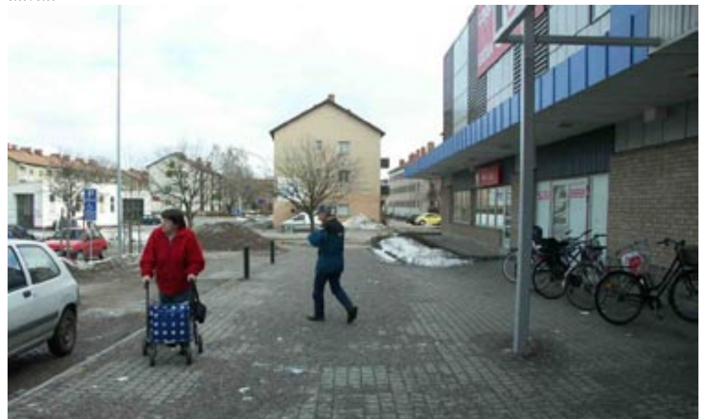
Bild 12-14. Hela den andra delen av platsen är synlig och har blivit den nya existerande vyn, men man ser även hela tiden vad som kommer att komma sedan. (Bild 13)