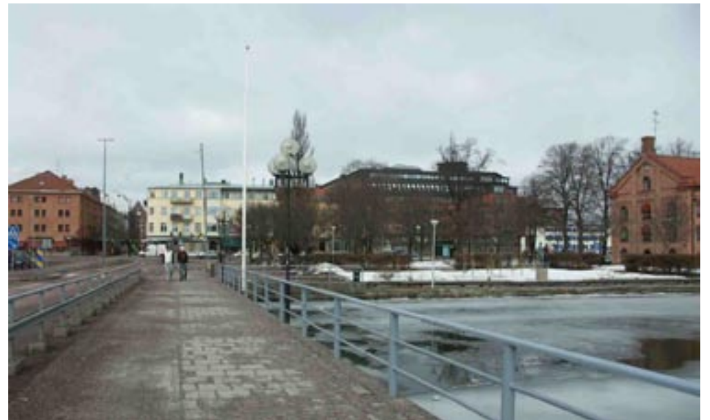
Bild 1-3. Upphöjd. När man går över Rådhusbron känner man sig lite upphöjd kring den öppna omgivningen. Man har stöd av räcket och lyktstolparna som gör att man känner sig säker och de visar riktningen. Både här och där är känt eftersom man ser vad som kommer längre fram.

Bild 4-6. Korsar en gräns. När man lämnar bron, och kommer in på fast mark känns det som om man har mer kontakt med platsen, men så länge man befinner sig på vänster sida om pollarna, som skapar en gräns, så är trottoaren här och smörtorget där. När man byter sida till höger om pollarna så känns det som om man har kommit till utkanten av platsen och har nu möjlighet att gå in i den.