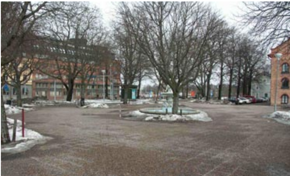
Bild 7. Träda in. När man träder in i rumsbildningen känns det som om man lämnar det gamla här och träder in i ett nytt.