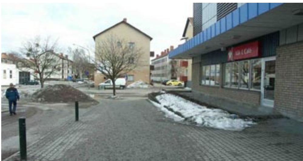
Bild 12-15. På andra sidan. När man går ut ur entrén till andra delen av platsen upplever man samma sak som på andra sidan, man får stöd av den staka kanten, väggen och eftersom det är så smalt så blir det mitt på oavsett vart man går. Även här är relationen ett känt här och ett känt där.

Bild 11. Mitt emellan. Inuti entrén av glas känner man sig omsluten på grund av det lilla utrymmet. Men känslan är inte jättestark eftersom man väggarna är transparenta. Både här och där är kända.