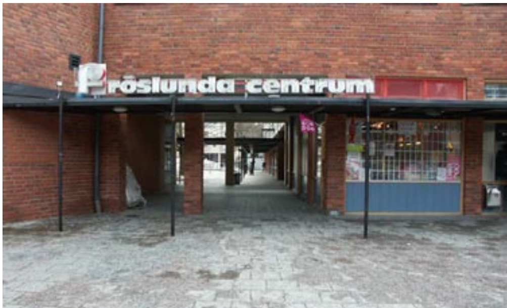
Bild 1. När man närmar sig centrumet från nordost ser man först bara ett hål i tegelväggen.