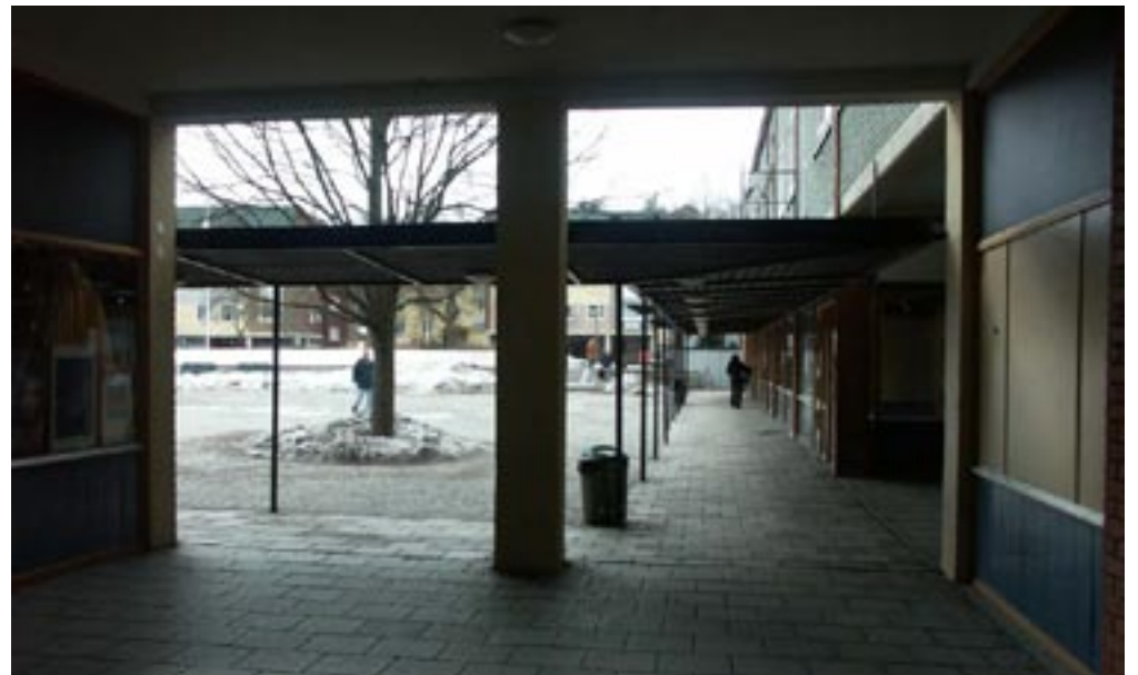
Bild 3. När man går i tunneln kan man plötsligt se att torget dyker upp på andra sidan, men synfältet är fortfarande begränsat.

Bild 2. När man går in i hålet vänjer sig ögonen vid den lägre ljusstyrkan och torget utanför ses mest bara som ljus.