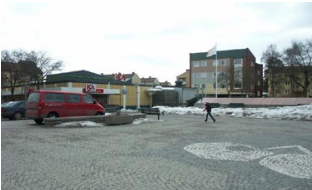
Bild 5-11. Gå ut på, vara mitt på och närma sig andra sidan. När man lämnar passagen känns det att man går ut i något nytt, man känner hur stödet från väggarna försvinner och hur kroppen sticker upp från den platta ytan. När man går över torget förändras helt tiden känslan från att gå ut på, vara mitt på och närma sig kanten där man kan få stöd igen. När man går ut på torget reagerar blicken direkt och söker en riktning och ett mål att gå mot.