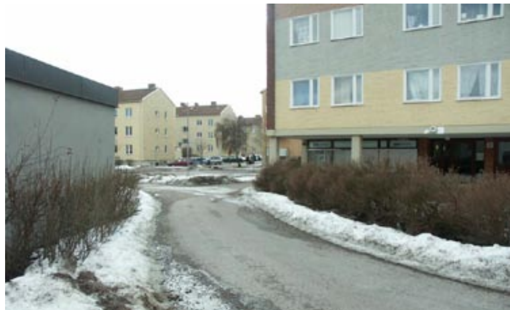
Bild 16. Den okända fortsättningen blir där. När man länkats till slutet av rampen dyker fortsättningen upp bakom hörnet på byggnaden och det okända blir det kända där.