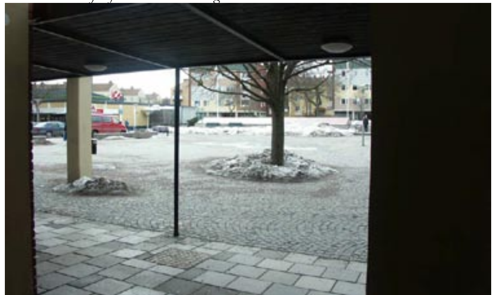
Bild 4. Man börjar få en bild av hur torget ser ut.

Bild 3. När man går i tunneln kan man plötsligt se att torget dyker upp på andra sidan, men synfältet är fortfarande begränsat.