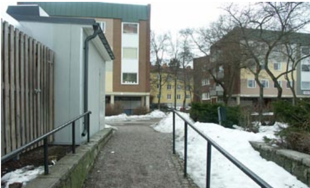
Bild 12-15. Länkas vidare. När man kommit till andra sidan torget och den utgång som blicken riktade in sig på infinner sig åter igen relationen mellan ett känt här och en okänd fortsättning som man genom rampen länkas vidare till.