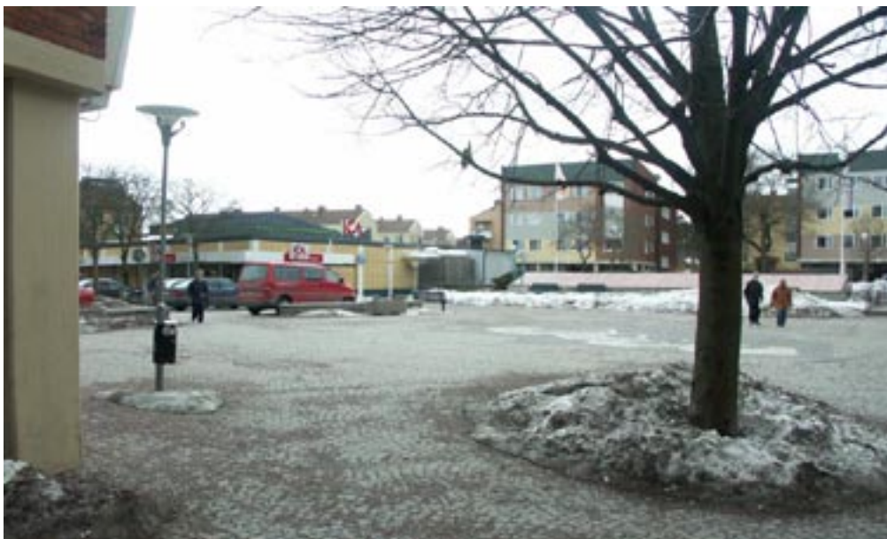
Bild 5. När man kommer ut på torget öppnar det sig och man får en överblick över den öppna ytan.