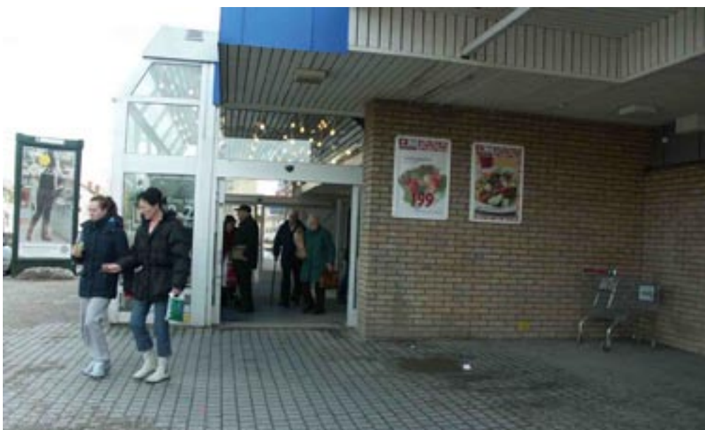
Bild 10. Man ser in i entrén.