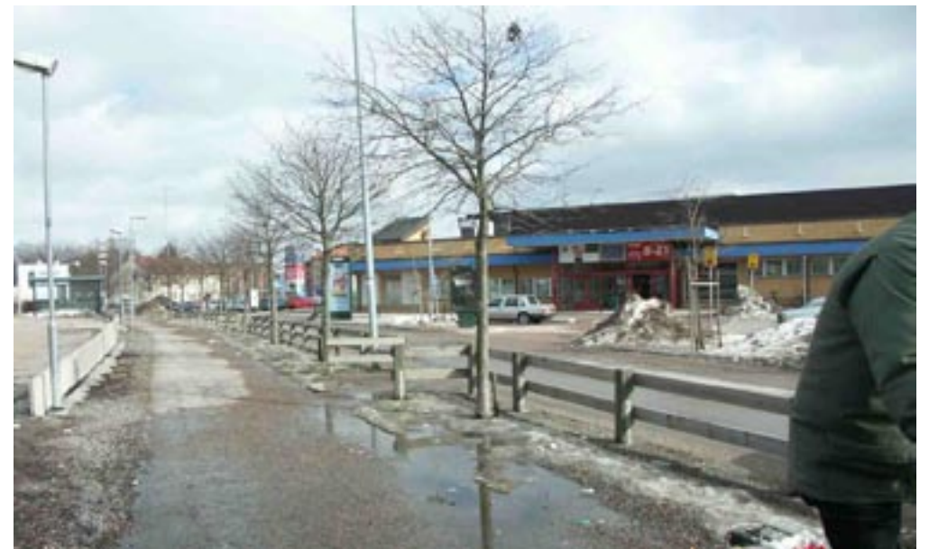
Bild 1-4. Man närmar sig platsen utan att förstå att det finns en plats där och vad den nästkommande vyn kommer att vara.

Kartan visar hur jag rörde mig på Sveaplan samt var bilderna är tagna