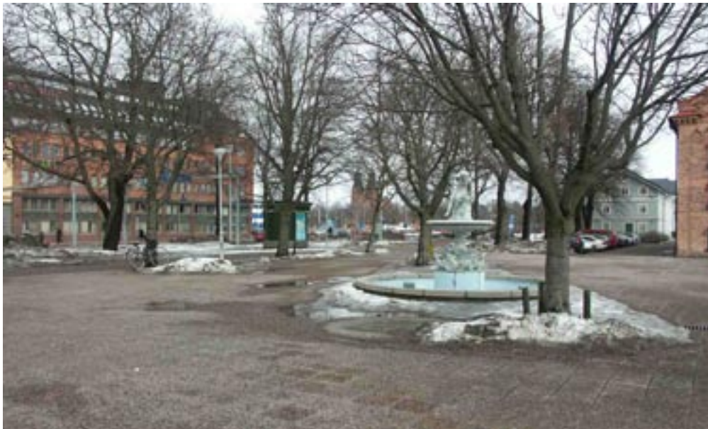
Bild 8-10. Man kan se hela platsen.