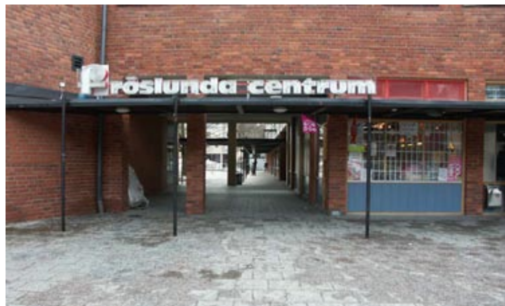
Bild 1. Utanför. Utanför centrumet är den första känslan som dyker upp är känslan av att vara utanför i det kända här och vetskapen om att man ska gå mot den okända fortsättningen. Passagen mot fortsättningen känns liten på grund av den massiva tegelväggen som omsluter ingången.