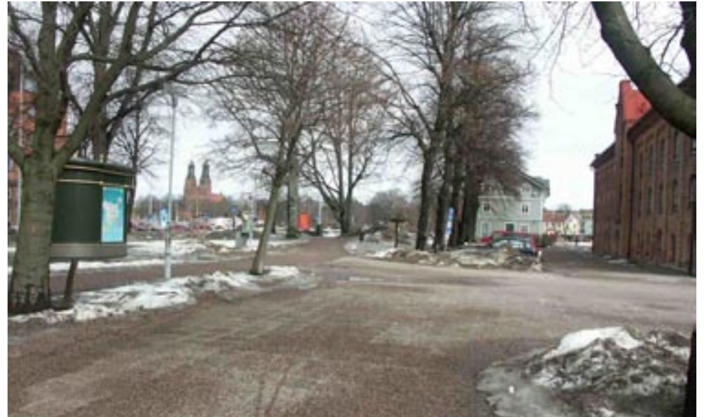
Bild 11-14. Man börjar att spana och sikta in sig på vad som kommer att bli den nästkommande vyn.