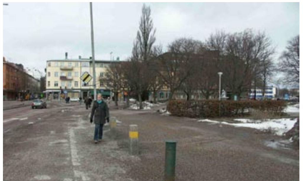
Bild 4-5. Man kan börja ana att det finns en platsbildning bland träden, man kan tänka sig vad som blir den nästkommande vyn.