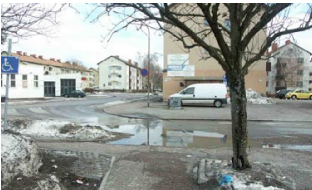
Bild 15. Det man såg längre bort tar helt över och man kan inte längre se platsen om man inte vänder sig om.

I bildserien ses inga drastiska förändringar som skapar intresse eller nyfikenhet. Allt sker gradvis och det mesta är synligt från och med att man först ser platsen. Denna serial vision kan inte jämföras med någon av Cullens exempel. Det finns visserligen en nivåskillnad, men eftersom man går förbi den i nedförbacke döljer den ingenting utan ger möjlighet att få en ännu bättre överblick. Men även då man går åt andra hållet så skapar nivåskillnaden ingen skillnad eftersom den är så flack att man kan se hela platsen fram till entrén ändå. Eftersom kontraster saknas känns platsen likformig och mer utsträckt än den egentligen är.