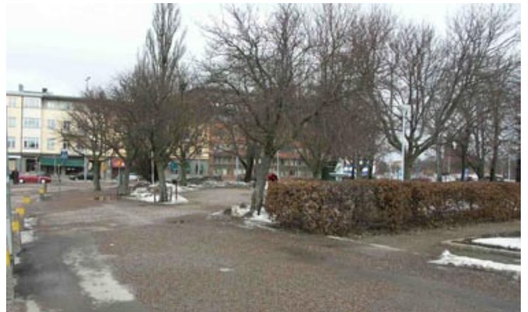
Bild 4-6. Korsar en gräns. När man lämnar bron, och kommer in på fast mark känns det som om man har mer kontakt med platsen, men så länge man befinner sig på vänster sida om pollarna, som skapar en gräns, så är trottoaren här och smörtorget där. När man byter sida till höger om pollarna så känns det som om man har kommit till utkanten av platsen och har nu möjlighet att gå in i den.

Bild 1-3. Upphöjd. När man går över Rådhusbron känner man sig lite upphöjd kring den öppna omgivningen. Man har stöd av räcket och lyktstolparna som gör att man känner sig säker och de visar riktningen. Både här och där är känt eftersom man ser vad som kommer längre fram.