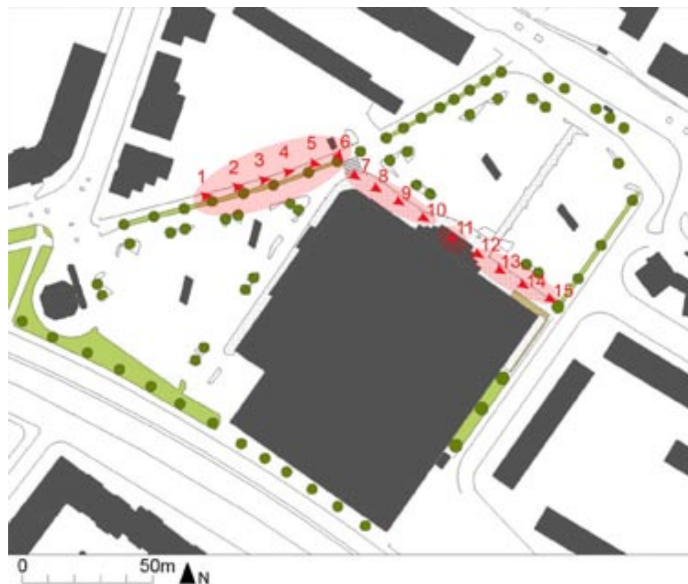
Kartan visar hur jag rörde mig på platsen, var bilderna är tagna samt vilka sinnesförmåelser jag upplevde

När man rör sig till och från platsen blir det uppenbart att det saknas länknings mellan parkeringen och ingången. Parkeringen och platsättningen utanför entrén är nästan helt separerade och känns som två olika bär . Platsen har bara en definierad kant, väggen mot centrumet, som kan ge stöd åt dem som vistas på platsen. Ute på parkeringen känns det som om man är väldigt utsatt, antingen känner man sig liten och sårbar bland alla bilarna eller om parkeringen är tom så känns det som om man är väldigt sårbar och uppstickande, som om man inte hör dit. Nära väggen är platsen att stå på ganska smal men det känns tryggare att vistas nära väggen än på parkeringen. Om bankomaten är upptagen och man måste stå i kö känns det som om man ockuperar den yta som är till för att gå på. Det tryggaste stället att stå på är närmast entrén, vid sidan av, under taket, där känner man sig mindre utlämnad än i övrigt. Inuti entrén är det trångt och det känns som om man snabbt måste passera för att inte blockera utrymmet. För att beskriva de känslor som kan dyka upp vid ett besök i Sveaplans centrum använder jag samma färdväg och bilder som vid serial vision.