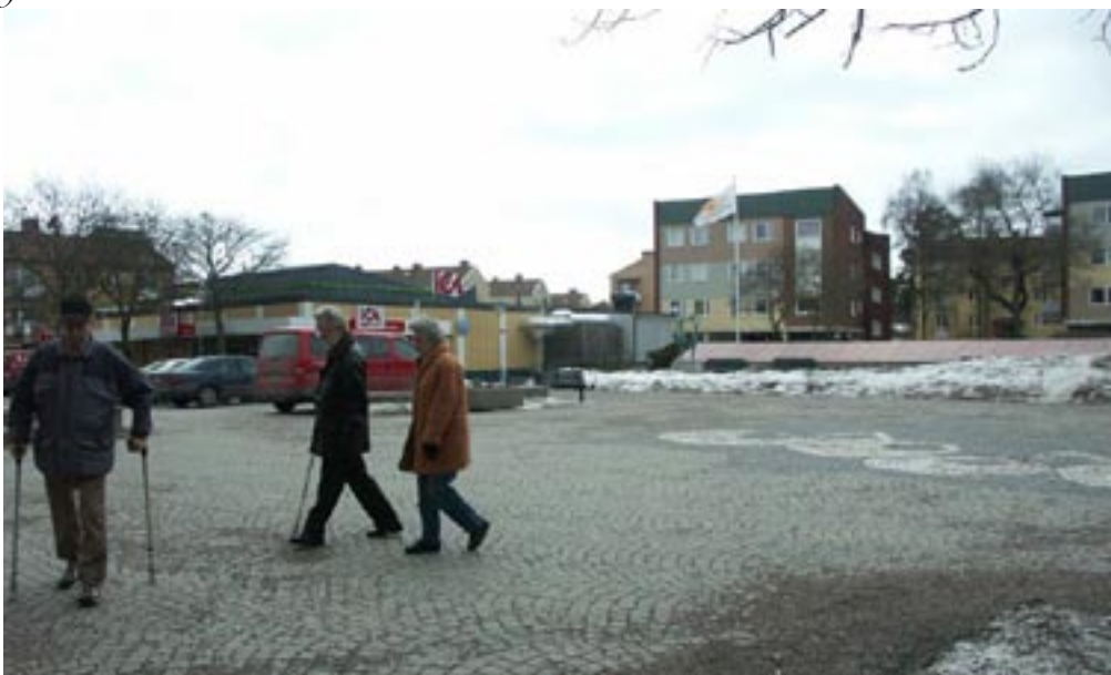
Bild 6-9. När man går över torget är synfältet mer eller mindre det samma, man får tillfälle att observera det som finns runt omkring. Det är en och samma existerande vy. (Bild 7)