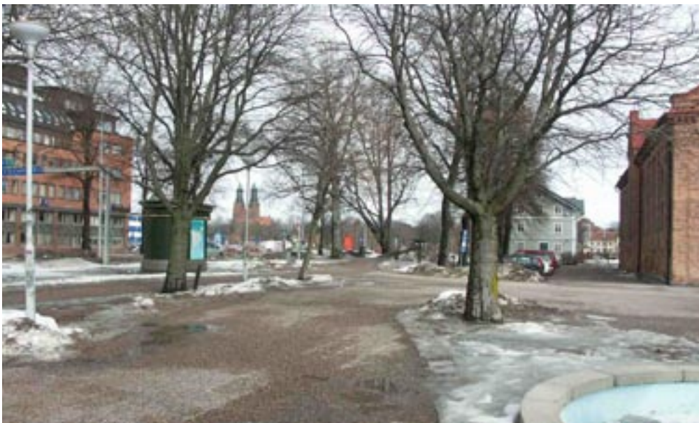
Bild 8-12. Korsplatsen. När man korsar torget känns det som om man har ganska mycket stöd av omgivningen hela tiden även om kroppen placerar sig mitt i rummet. Känslan av stöd hela tiden beror på att rummet är litet och det inte är helt tomt och öppet.