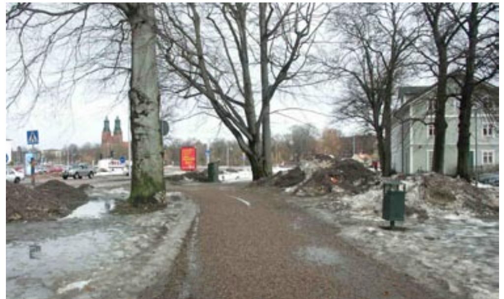
Bild 13-17. Gå ut ur och vidare. När man kommer ut på gång- och cykelvägen känns det som om man börjar gå ut ur rummet men gränsen är flytande och det går inte att säga exakt var gränsen går. Även då man lämnar rummet befinner man sig i ett känt här som övergår i ett känt där.