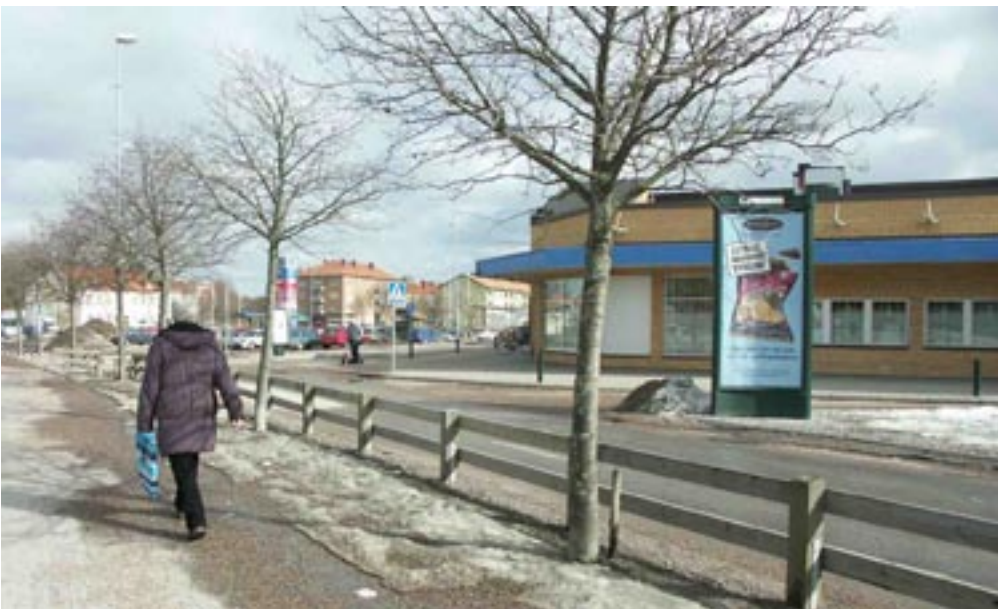
Bild 7-9. Man ser hela platsen fram till entrén i glas och har bra överblick om vad som finns runtomkring.