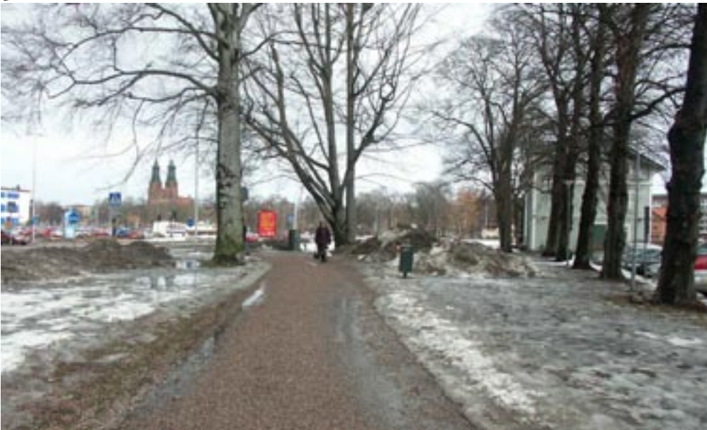
Bild 15-17. Den nästkommande vyn blir gradvis mer och mer visuell och den blir den existerande vyn.

I bildserien av Smörtorget ser man hur träden hela tiden skiftar plats och gör att vyerna ändras även om det inte gör att hela vyn ändras. Genomsiktligheten på platsen gör att den nästkommande vyn aldrig blir någon överraskning eftersom skiftningarna sker gradvis. Från bildserien kan paralleller dras till Cullens första exempel om det utvecklande dramat mellan geometriska former som utvecklar sig desto mer man rör sig. De geometriska formerna i Smörtorgetts fall är träden.