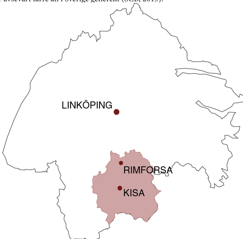
FIGUR 2: Kindas lokalisering i Östergötland samt viktiga tätorter.

Förutom att kommunen befinner sig i en negativ befolkningstrend, så skiljer sig också den demografiska sammansättningen från Sverige i stort. Antalet personer som är mellan 20-40 år i Kinda är avsevärt färre än i Sverige generellt (SCB, 2015).