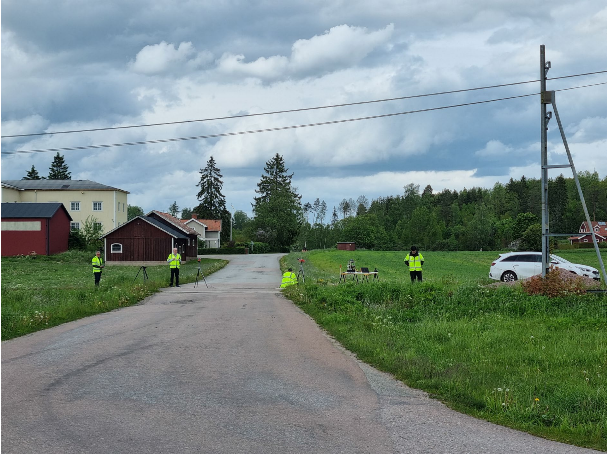
Figur 3. Plankorsningen mellan Tortuna station och Tillberga.

På stationsområdet genomfördes flera experiment med framför allt personer som närmade sig spårområdet. Vid plankorsningen utfördes inte bara mätningar av personer utan även av olika fordon som cyklar och bilar. I figur 4 syns hur personer, cyklar och bilar ser ut i en Lidarbild. Både radarbilder och lidarbilder är svåra att presentera på bild då radar och lidardata är fyrdimensionella och inte två dimensionella som i en vanlig fotografisk bild.