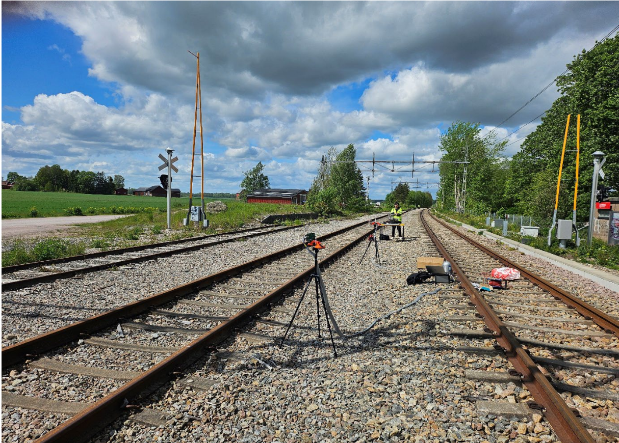
Figur 2. Stationsområdet i Tortuna

2030. 6G kommer då att göra båda monostatiska och bistatiska radarmätningar tillgängliga utefter i princip hela Sveriges järnvägsnät. Än längre bort mellan rälsen vid ett bord står en man och övervakar KTHs lidarutrustning som användes under experimentet. Lidar har högre upplösning än radar men har inte samma räckvidd som radar och är betydligt mer väderkänslig än radar. Dom bildar dock ett bra komplement och båda sensorerna är intressanta för järnvägsövervakning. I figur 3 syns plankorsningen där också experiment utfördes. I detta fall placerades radarenheterna och lidarutrustningen utefter vägen.