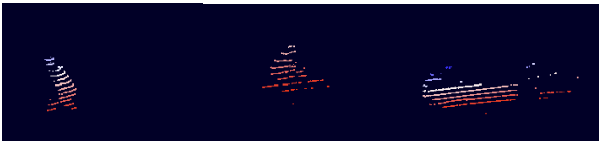
Figur 4. Lidarbilder från plankorsningen.

På stationsområdet genomfördes flera experiment med framför allt personer som närmade sig spårområdet. Vid plankorsningen utfördes inte bara mätningar av personer utan även av olika fordon som cyklar och bilar. I figur 4 syns hur personer, cyklar och bilar ser ut i en Lidarbild. Både radarbilder och lidarbilder är svåra att presentera på bild då radar och lidardata är fyrdimensionella och inte två dimensionella som i en vanlig fotografisk bild.