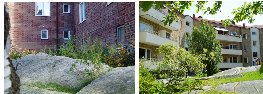
Terräng tätt intill på Syster Estrids gata respektive Doktor Sahléns gata – Foton 2004

Byggtekniken mellan 1930- till 50-talet, gjorde det billigare att bevara naturen än att ta bort den. Att spara naturmark var dessutom en av grundpelarna i den ideologi som rådde för anläggning av utemiljöer. 66