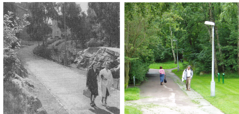
Separerade gångstråk i Södra Guldheden, 1953 d respektive 2004

I allmänhet skedde trafikföringen inom denna typ av område, genom så kallad utifrånmatning. Det innebar att bostadsområdet omgavs av en genomfartsgata, så kallade matargata, där biltrafiken leddes fram och som sedan övergick i lokalgator, så kallade entrégator, vilka ledde fram till husen. 37