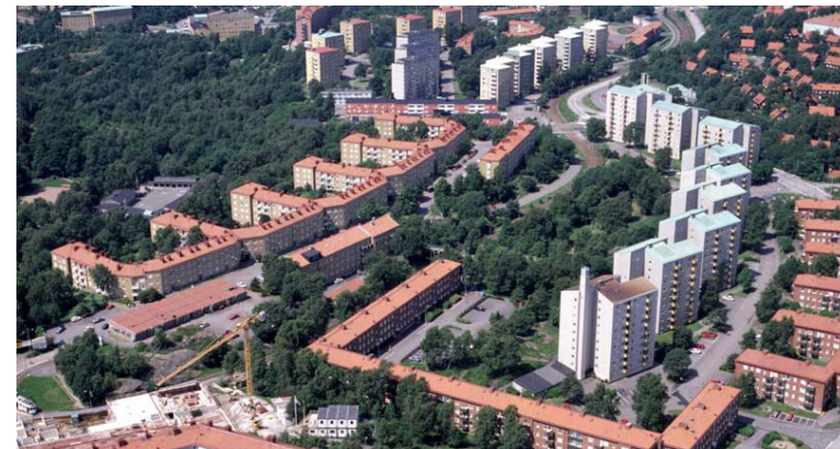
Husgrupperingar i Södra Guldheden

Principerna var att man med likartad utformning skulle ordna bostäderna i grupper. Dessa bostadsgrupper skulle ligga något avskilda från varandra genom vägar och/eller grönska. 24