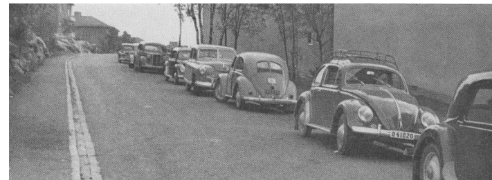
Parkeringsproblem i Södra Guldheden redan år 1953 °

Efter att länge ha varit ett relativt fattigt land hade Sverige efter andra världskriget ryckt fram och blivit en av världens rikaste länder. Då Sverige undgick krigets förstörelse och hade tillgång till råvaror som var begärliga på världsmarknaden, steg nationalinkomsten snabbare än i många andra industriländer. Till följd av det stigande välståndet ökade även biltätheten i landet. 36