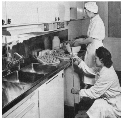
Funktionsstudier i provkök, 1945 e

Forskning stöddes för att utveckla byggande, planering och boende. I början av fyrtioalet skapades Hemmets forskningsinstitut. För att utveckla normer och principer som skulle styra byggandet sågs forskningen som viktig, inte minst under de första tjugo åren. 48 Statens nya och mer omfattande ansvar öppnade upp för en utveckling av en betydande normsamling. 47