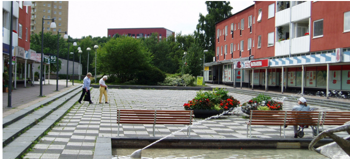
Doktor Fries torg, ett tidstypiskt grannskapstorg – Foto 2004

dess placering i staden. Grannskapstorgen skulle vara till för den lokala enheten, för det grannskapsplanerade bostadsområdet. Därmed placerades de centralt i området och inte strategiskt vid viktiga leder som gick förbi området. 34