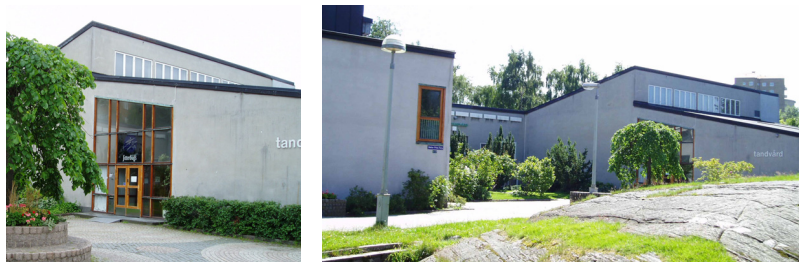
Forum-huset på Doktor Fries torg – Foto 2004

omgivningen för att markera dess lokala identitet och karaktär. Området skulle ha ett gemensamt centra där affärer och annan service, kommunala verksamheter och lokaler för föreningar och tillställningar skulle finnas. I flera städer kom samlingslokalernas byggnad ofta att få namnet Forum, och så även i Södra Guldheden. Namnet knöt an till en klassisk demokratitradition. 24