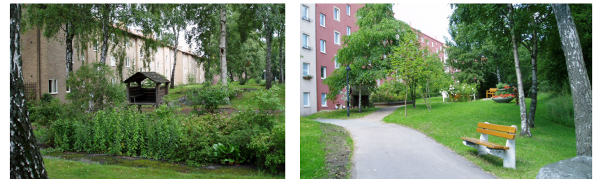
Bostadsgårdar på Doktor Westrings gata respektive Doktor Belfrages gata – Foton 2004

Folkhemmets bostadsgårdar står för en enkelhet och harmoni och de tre viktigaste grunddragen är rumsligheten, funktionsuppdelningen och växtligheten. 53