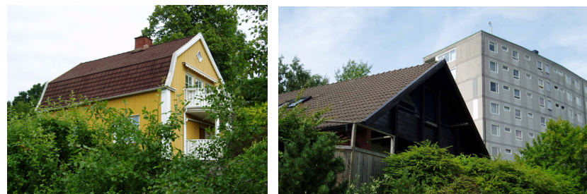
Villabebyggelse i Mölnald – Foton 2004

I söder angränsar Södra Guldheden till Mölnalds kommun, med dess blandning av friliggande villor. De första husen i området byggdes 1914, då läget ansågs gynnsamt med närheten till Göteborg. 101 Bebyggelsen ligger huvudsakligen i en dalgång med Södra Guldheden högt beläget ovanför. Där de villor som klättrar uppför berget möter 1960-tals bebyggelsen i Södra Guldheden, är skillnaden i såväl hustyp som skala, mycket påtagliga.