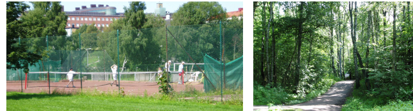
Mossen – Foton 2004

"Mossen" som ligger öster om Södra Guldheden, utgörs av ett populärt grönområde. Förutom naturlig grönska finns där även motionsslingor samt en idrottsanläggning, med bland annat ett flertal fotbolls- och tennisplaner. Mossen är ett viktigt rekreationsområde i Göteborg.