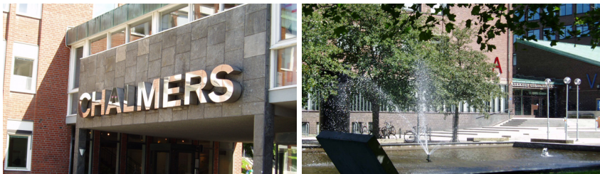
Chalmers – Foton 2004

Chalmersområdet ligger beläget öster om Södra Guldheden och har legat på sin nuvarande plats sedan 1926. 99