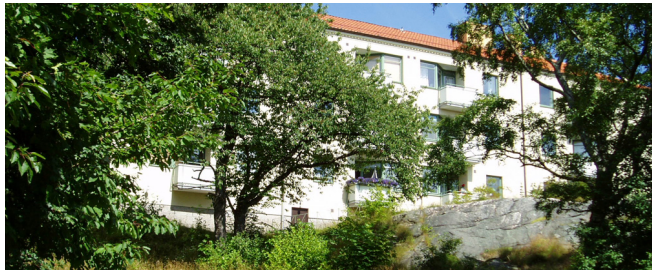
Norra Guldheden, Reutersgatan – Foto 2004

har området blivit ett mönsterområde, som inspirerat många andra tillkomna bostadsområden runt om i Sverige. 94 Byggnaderna i Norra Guldheden är goda exempel på arkitektur från 1940-talet och lägenheternas välstuderade planlösningar sägs ha särskilda kvaliteter. 93