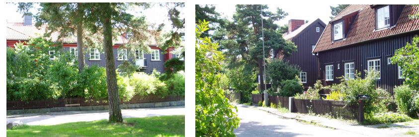
Furuplatsen respektive Mossgatan i Landala egnahem – Foton 2004

Området ligger nordost om Södra Guldheden och bebyggdes under åren 1913-22. 96