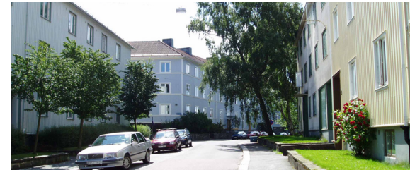
Landshövdingehus på Fyrverkaregatan – Foto 2004

Formspråket i planen är typisk för Lilienberg med gator som följer terrängen, tydliga fonder och gator som öppnar sig mot utsikten över staden. Gårdarna har välbevarade och tidstypiska exteriörer med bevarade förträdgårdar. 95