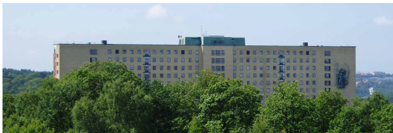
"Central-komplexet" – Foto 2004

Sjukhusområdet ligger väster om Södra Guldheden och har legat på sin nuvarande plats sedan år 1900. Därefter har flera stora anläggningar byggts upp och det mest utmärkande är Central-komplexet som stod klart 1959 och är 18 våningar högt. 100