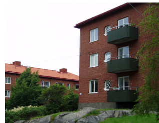
15. Kamhus, Doktor Liborius gata