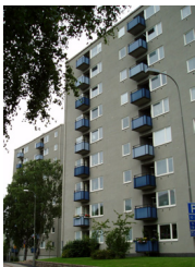
13. Punkthus, Syster Ainas gata