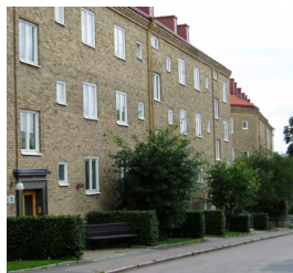
17. Kamhus, Doktor Bex gata