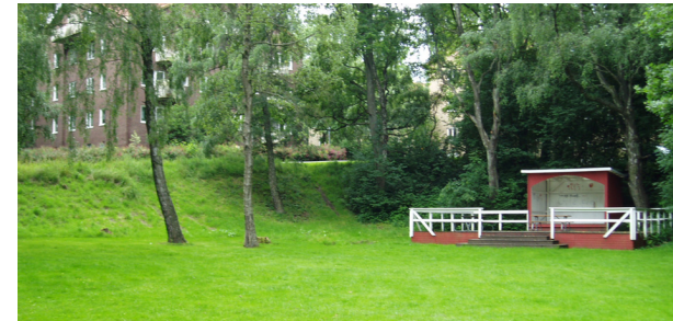
Södra Guldhedens stadsdelspark – Foto 2004

Naturmark återfinns också mellan och tätt intill husen, vilket följer de ideologier som gällde kring grönska under områdets tillkomst. Allt enligt grannskapsprincipens teorier finns det dessutom två anlagda parker centralt belägna i området. Dessa har fått en tidstypisk karaktär genom de stora träden och de sammanhängande gräsmattorna. Genom grönskan sträcker sig i regel gång- och cykelvägarna. Varken vid stadsdelsparken eller genom grönområdet går någon biltrafik. Dessa platser är därmed till stora delar fria från buller, vilket är mycket positivt.