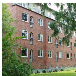
30. Lamellhus, Syster Emmas gata