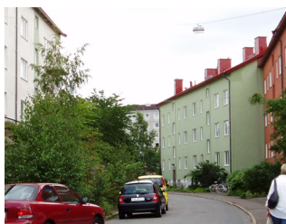
31. Lamellhus, Doktor Sydows gata