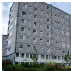
33. Doktor Forselius backe