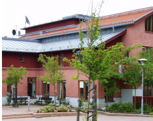
14. Neubergska ålderdomshemmet