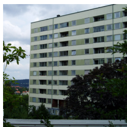
32. Skivhus, Doktor Forselius gata