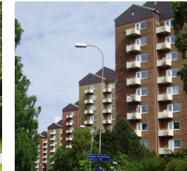
21. Punkthus, Syster Estrids gata