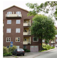
25. Punkthus, Doktor Westrings gata