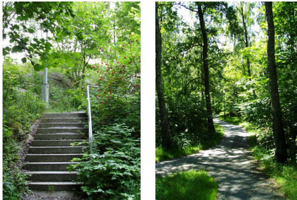
Naturlig grönska i Södra Guldheden – Foto 2004

Grönskan i Södra Guldheden är mycket påtaglig och är ett betydande karaktärsskapande element i området. Den är av skild karaktär och utgörs bland annat av naturmark genom ett större sammanhängande grönområde i Södra Guldhedens västra del.