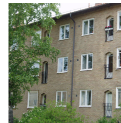
26. Lamellhus, Doktor Westrings gata