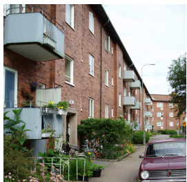
28. Sammanbyggda lamellhus, Syster Emmas gata