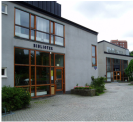
10. Biblioteket, Doktor Fries torg