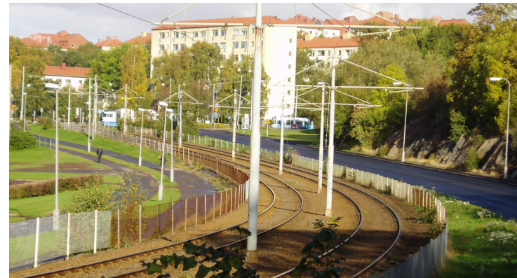
Doktor Allards gata mot Wavrinskys plats – Foto 2004

begränsar framkomligheten. En annan negativ konsekvens av trafiksystemet är att det resulterar i överdimensionerade trafiklandskap, där de olika trafikslagen går sida vid sida. Detta tar bort den annars så omsorgsfulla karaktären av området.