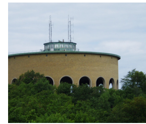
23. Södra Guldhedens vattentorn