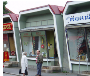
18. Butikslänga, Doktor Bex gata