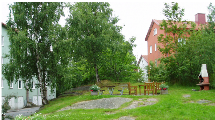
Uteplats, här vid Doktor Sydows gata – Foto 2004

Växtligheten är, som tidigare nämnts, det största karaktärsskapande elementet i Södra Guldheden. Utemiljöerna har, förutom trädens höga kvaliteter i området, dessutom en tilltalande rumslighet genom de mänskliga proportionerna. De är också måttligt funktionsuppdelade vilket är ett positivt bidrag. När utemiljön är av anlagd karaktär på bostadsgårdarna, finns det vanligtvis vackra blomsterrabatter.