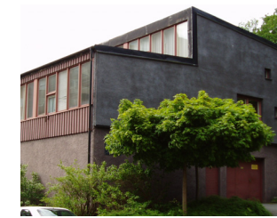
24. Ateljéer och radhus, Syster Estrids gata