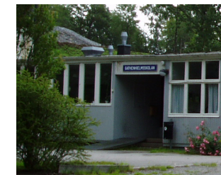
27. Gathenhielmsskolan (Laborantskolan)