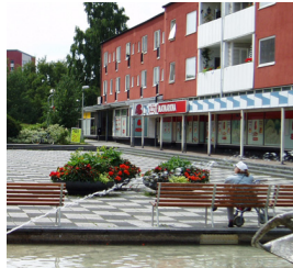
11. Doktor Fries torg