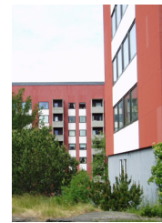
22. Tjocka lamellhus, Doktor Lindhs gata