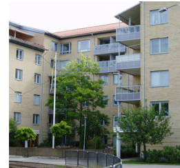
19. Doktor Sydows gata