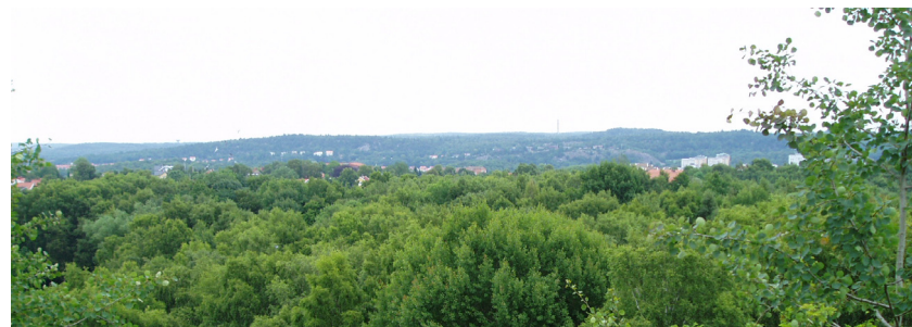
Utsikt från Doktor Allards gata/Doktor Weltzins gata – Foto 2004

Tack vare Södra Guldhedens höga läge i staden, finns det många platser med vidsträckt utsikt. Dessa får många bostäder ta del av, men det finns även platser i utemiljön där de boende kan ta del av denna. Att man kan se ut över staden är en stor kvalitet som positivt bidrar till områdets karaktär.