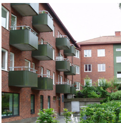
16. Sammanbyggda lamellhus, Doktor Weltzins gata