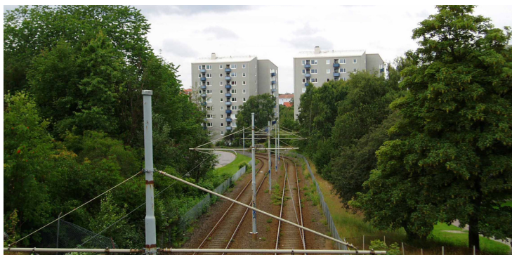
Spårvagnens banvall, en barriär – Foto 2004

Trafiksystemet utgör inte så stort problem då det gäller tillgängligheten eftersom det är relativt lätt att ta sig över vägarna. Trafikarbetet är inte heller så högt att det skulle påverka tillgängligheten något nämnvärt. Något som dock påverkar tillgängligheten ur denna aspekt är spårvägens banvall som går genom området. Här är det omöjligt att ta sig över om man inte väljer att gå till de två övergångarna som finns, det ena på markplan vid Doktor Fries torg och det andra planskilt via en gångbro närmare ändstationen Doktor Sydows gata.