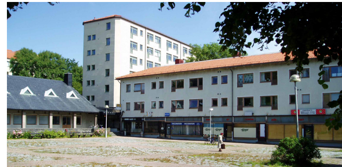
Guldhedstorget – Foto 2004

Torget byggdes som grannskapstorg åt Norra Guldheden och stod klart 1945 till utställningen "Bo bättre". 93