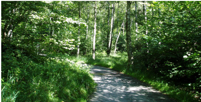
Gångstråk i Södra Guldhedens grönområde – Foto 2004

Trygghet är inte bara en mänsklig rättighet utan också en förutsättning för att ett område ska upplevas trivsamt. Södra Guldheden betraktas som ett relativt lugnt område av polisen 111 men som bekant är behovet inte den faktiska risken för brott överensstämma med upplevd risk. Eftersom området innehåller stora delar grönska finns det därmed också stora arealer som kan upplevas mörka och folktomma när kvällen kommer. Även under dagtid kan vissa delar av området kännas öde, däribland det större sammanhängande grönområdet i Södra Guldhedens västra del.