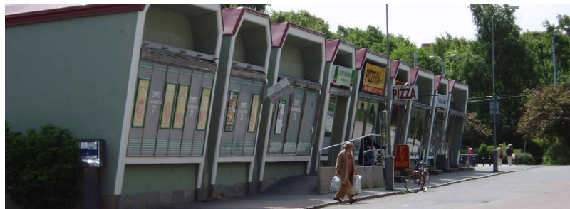
Butiker på Doktor Bex gata – Foto 2004

Denna butikslänga ligger knappt 400 meter sydost om Doktor Fries torg och är belägen vid spårvagnens ändhållplats. Butikslängan uppfördes 1950-51 och har troligtvis Göteborgs mest originellaste skyltfönster. Den har ett varierande utbud och är relativt välbesökt. Butikslängan klassas som kulturhistoriskt intressant, tack vare dess karakteristiska utformning. 104