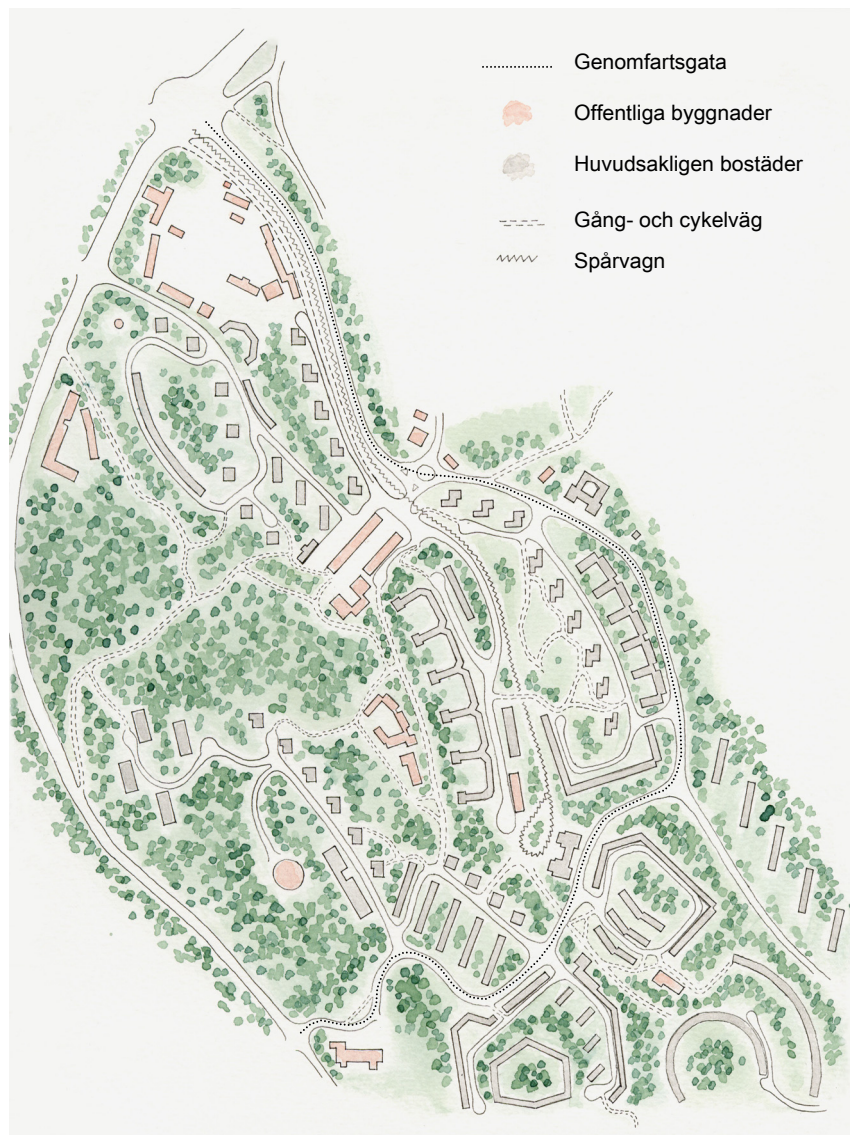
Illustration över Södra Guldhedens vägnät

från början inte har anpassats till den mängd bilar som det idag finns i området, sammantaget med svårigheterna att angöra nya parkeringsytor, har detta lett till att det är ett stort behov av parkeringsplatser i Södra Guldheden. Parkeringsnormen för nybyggnation, som gäller för denna del av Göteborg är idag 0.1 bilplatser per studentlägenhet och för vanliga lägenheter är normen 0.8 bilplatser per lägenhet, besöksparkeringar inräknade. 91