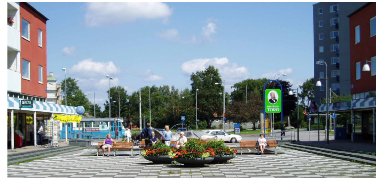
Doktor Fries torg – Foto 2004

Mitt i den stora entrén till torget finns en skulptur och fontän som heter Fina fisken. Allt detta bidrar till torgets mycket tidstypiska karaktär. 108