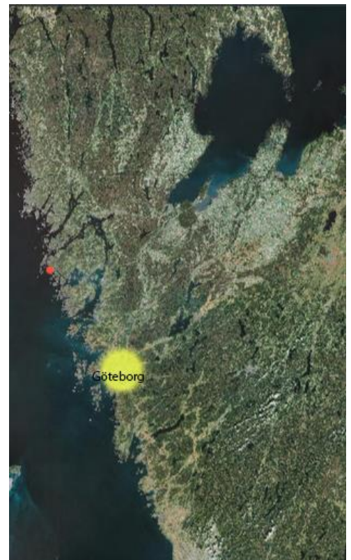
Hälleviksstrands lokalisering i förhållande till Göteborg