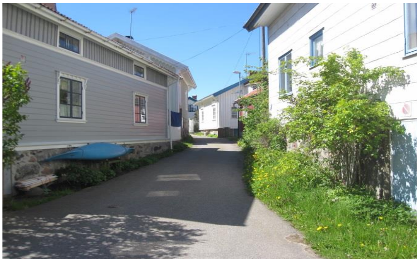
Exempel på bebyggelsen i Hälleviksstrand

Bebyggelsen i den centrala delen av Hälleviksstrand är urtypisk för ett gammalt traditionellt fiskeläge. Längs stränderna ligger täta rader med sjöbodarna, vilka är målade i ockragult och falurött. Bakom sjöbodarna ligger bostadshusen tätt intill varandra. Bebyggelsen sträcker sig upp längs berget med gavlarna mot havet. Bostadshusen är målade i ljusa kulörer. I utkanterna av den gamla samhällskärnan ligger större hus omgivna med trädgårdar, vilka är byggda senare. De flesta av husen som ligger i samhällskärnan nyttjas inte året runt, utan bara som fritidshus. De åretruntboende bor huvudsakligen i de nyare husen i samhällets utkanter. I Hälleviksstrand finns ca 30 hyresrätter samt 12 bostadsrätter (Orust kommun 2009).