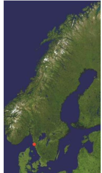
Hälleviksstrands lokalisering i Sverige

Under 1700-talet använde bönder kring Hällevik Lerkilen i Hälleviksstrand som hamn. Sillfisket lockade folk från Orust inland hit och fiskeläget utvecklades. På 1800-talet blev Hälleviksstrand även utskepningshamn för havre och stora magasin byggdes på hamnplanen. (Orust kommun 2009)